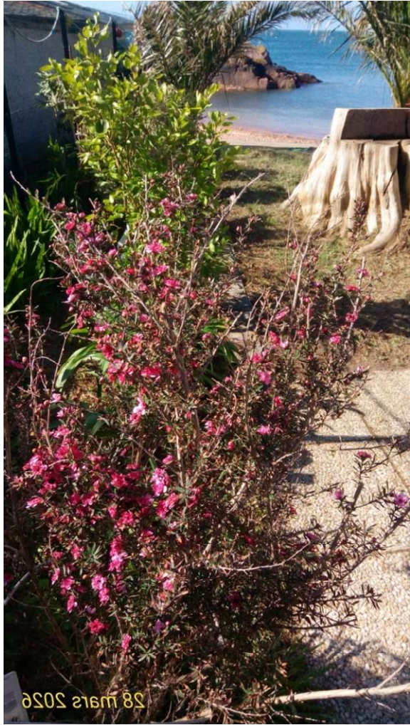
28 mars 2026