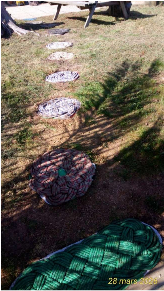
28 mars 2026