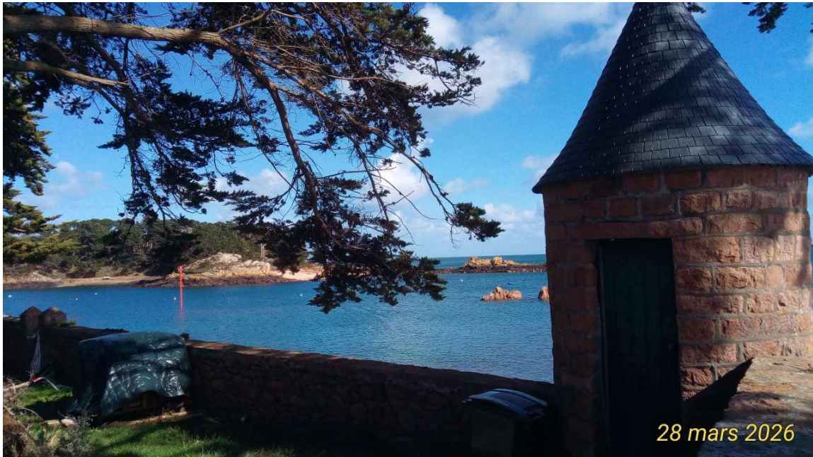
28 mars 2026